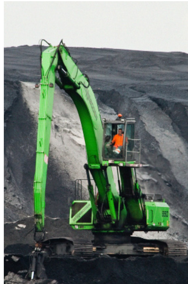
Los países ricos en recursos pueden dirigir mejor los beneficios de las empresas mineras

El sector minero también puede contribuir revisando proactivamente y reajustando sus políticas de compras, asegurando que mantiene las normas técnicas, ambientales, operacionales y de seguridad requeridas, a la vez que también considera las realidades locales. Las políticas de compras en minería podrían alinearse con las políticas gubernamentales existentes para aprovechar que el potencial tenga un impacto local duradero y significativo. Finalmente, desarrollar programas que fomentan la diversificación de la economía local es estratégico para reducir la dependencia de la compañía minera únicamente.