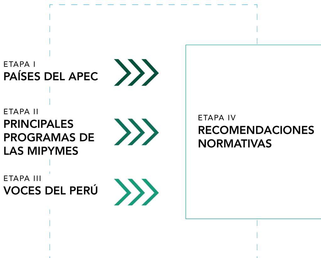
GRÁFICO 1 Metodología

En la Etapa I (revisión de las publicaciones), se realizó un análisis comparativo de las políticas existentes que tienen como objetivo apoyar a las mipymes en cinco países mineros (Australia, Canadá, Chile, México y Perú) de la comunidad del APEC. Se creó un marco personalizado de la evaluación de las políticas de las mipymes que abarcó cinco indicadores: emprendimiento social, tributación, igualdad de género, financiamiento de fondos y capacidad institucional.